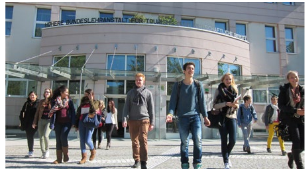
HLTW 13 Bergheidengasse Bergheidengasse 5-19, 1130 Wien

Geblockte Vorlesungen sowie Prüfungen finden in Wien Hietzing in der HLTW13 statt. Prüfungen können aber auch an den Standorten Innsbruck und Spittal/Drau abgelegt werden.