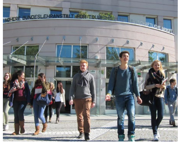
HLTW 13 Bergheidengasse Bergheidengasse 5-19, 1130 Wien

Bereits zu Beginn Ihres Studiums erhalten Sie einen genauen Terminplan für Ihre gesamte Studienzzeit. So können Sie Ihre Studienzeiten perfekt planen und in Ihren (Berufs)-Alltag integrieren.